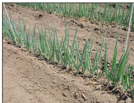
無かん水区（5月時点）