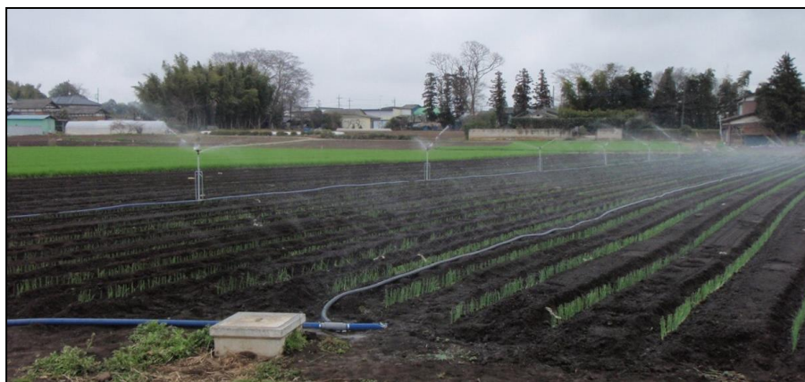
かん水状況（平成27年春）